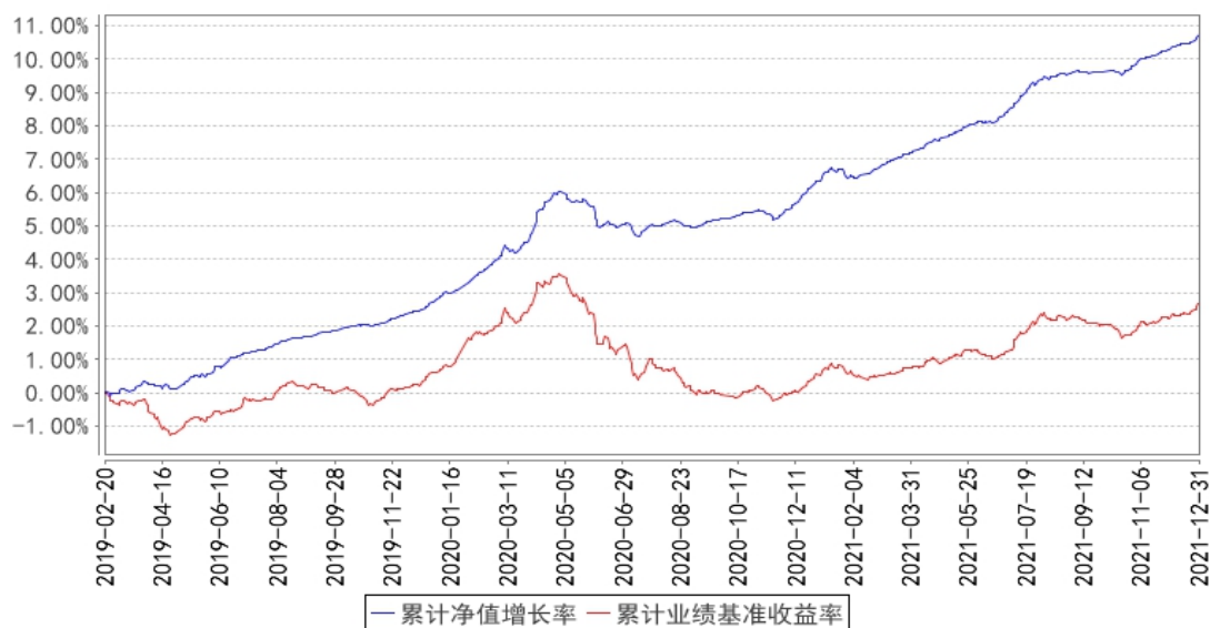
国寿安保泰和纯债债券累计净值增长率与同期业绩比较基准收益率的历史走势对比图

注：本基金基金合同生效日为 2019 年 02 月 20 日，按照本基金的基金合同规定，自基金合同生效之日起 6 个月内使基金的投资组合比例符合基金合同关于投资范围和投资限制的有关约定。本基金建仓期结束时各项资产配置比例符合基金合同约定。图示日期为 2019 年 02 月 20 日至 2021 年 12 月 31 日。