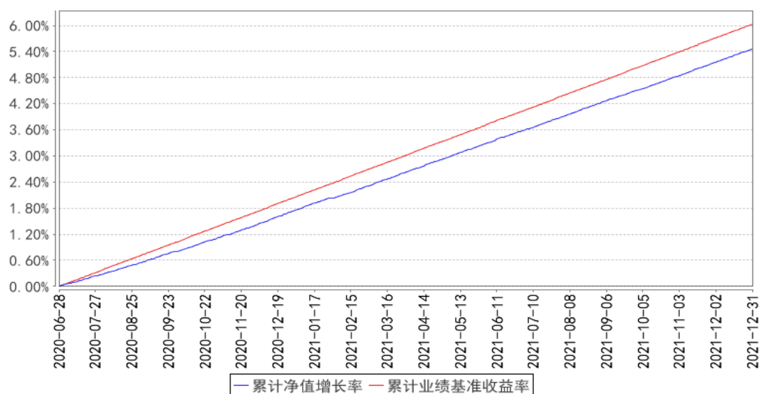
国寿安保瑞和纯债66个月定期开放债券累计净值增长率与同期业绩比较基准收益率的历史走势对比图

注：本基金基金合同生效日为 2020 年 06 月 28 日，按照本基金的基金合同规定，自基金合同生效之日起 6 个月内使基金的投资组合比例符合基金合同关于投资范围和投资限制的有关约定。本基金建仓期结束时各项资产配置比例符合基金合同约定。图示日期为 2020 年 06 月 28 日至 2021 年 12 月 31 日。