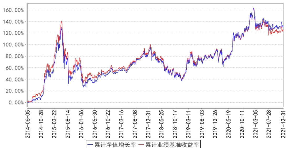
国寿安保沪深300ETF联接累计净值增长率与同期业绩比较基准收益率的历史走势对比图

注：本基金基金合同生效日为 2014 年 06 月 05 日，按照本基金的基金合同规定，自基金合同生效之日起 6 个月内使基金的投资组合比例符合基金合同关于投资范围和投资限制的有关约定。本基金建仓期结束时各项资产配置比例符合基金合同约定。图示日期为 2014 年 06 月 05 日至 2021 年 12 月 31 日。