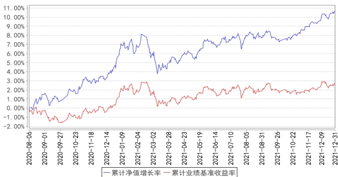
国寿安保策略优选3个月持有混合（FOF）累计净值增长率与同期业绩比较基准收益率的历史走势对比图

注：本基金基金合同生效日为2020年8月06日，按照本基金的基金合同规定，自基金合同生效之日起6个月内使基金的投资组合比例符合基金合同关于投资范围和投资限制的有关约定。本基金建仓期结束时各项资产配置比例符合基金合同约定。图示日期为2020年8月06日至2021年12月31日。